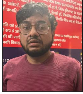
साथ ही जीत हार पर भी ऑनलाइन सट्टा लगाया जा रहा था। थाना चमनगंज पुलिस को मिली सूचना के आधार पर कार्रवाई करते हुए पुलिस ने एक अभियुक्त को 1

□ पकड़ा गया एक अभियुक्त अपने घर में ही चला रहा था सट्टा बाजार - सटीक सूचना पर थाना चमनगंज पुलिस ने की कारवाई □ अभियुक्त के पास से 180140 रुपये और 13 मोबाइल बरामद