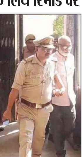
की न्यायिक हिरासत पर भेजा गया है। आरोपी के घर से अतीक अहमद के कई बेनामी संपत्ति और अन्य मामलों के दस्तावेज बरामद हुए थे।