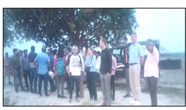
गांव के प्रतिनिधियों के बीच बैठकर तैयार किया था वह अब साकार होने को है। प्रदेश सरकार की पहल पर वर्षों से इस का सर्वेक्षण चल रहा है। अभी छः माह पहले इजराइल की टीम ने आकर सर्वे सिंचाई विभाग के अधिकारियों के साथ किया था। अब बीती शाम बुधवार को डेनमार्क यूरोप की टीम ने शिपिंग गौर प्रोफेसर आई आई टी

संवाददाता प्रयागराज। मैलहन झील से निकली वरुणा नदी को प्रयागराज बांदोही वाराणसी के कई गांव से होती हुई अस्सी घाट वाराणसी में गिरती है और गंगा नदी में समाहित हो जाती है। इस पौराणिक नदी की उत्पत्ति हेतु कई गांव के लोगों ने मैलहन झील में बहुत बड़ा यज्ञ किया था। कथित रूप से तब वरुणा की उत्पत्ति हुई। इसी के नाम पर फूलपुर जौनपुर मार्ग पर बरणा बाजार और वहीं पर वरुणेश्वर महादेव का मंदिर बना जो आस्था का केंद्र है। हर वर्ष मेला लगने लगा। अब वर्तमान सरकार ने वर्ष 2008 में तत्कालीन कमिश्नर द्वारा मैलहन झील के सुंदरीकरण और मैलहन से बनारस तक नदी की खुदाई व सफाई का जो खाका दर्जनों