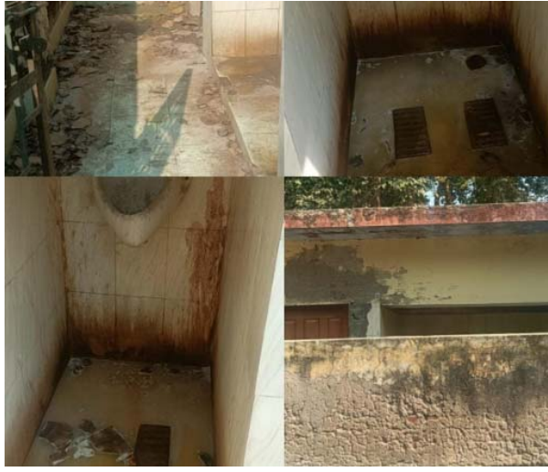
बदबू के बीच शौचालय व मूत्रालय का उपयोग करने को मजबूर हैं या फिर उन्हें शौच के लिए इधर उधर भटकना पड़ता है। जो पंचायतीराज विभाग के मुंह पर सीधा तमाचा है।

तहत गांवों को खुले में शौच मुक्त (ओडीएफ) कराया और अब ओडीएफ प्लस की बारी है। वहीं दूसरी तरफ ब्लाक मुख्यालय इस योजना को गति देने की बजाय खुद पलीता लगा रहा है। ब्लाक परिसर की बात तो दूर यहां मुख्यालय द्वार के सामने बने शौचालय में कूड़े कचरे का ढेर लगा है। ब्लाक मुख्यालय पर अधिकारियों ने आधा दर्जन से अधिक सफाईकर्मी ग्राम पंचायतों की बजाय अपनी आवाभगत के लिए लगा रखे हैं फिर भी शौचालय सफाई के अभाव में बदहाल है। महीनों से सफाई न होने से गंदगी व बदबू की वजह से शौचालय के बगल से निकलना दुभर हो गया है। जिसके चलते ब्लाक मुख्यालय पर आने जाने वाले लोग व जनप्रतिनिधि गंदगी व